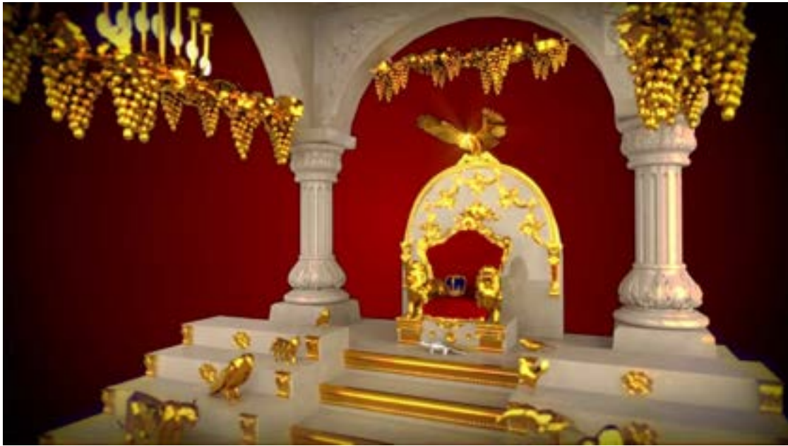
הדגמה של כיסא שלמה